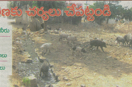
ఎగ్జిల్ నగర్లో రోడ్డుపై ప్రవహిస్తున్న మురుగు నీరు, పండుల స్ట్రెస్ విహారం

దీని మూలంగా ఆ ప్రాంతంలో దోమలు వృద్ధి చెందుతున్నాయి. మల్లాపూర్ డివిజన్లో కైలాసగిరి, రాజీవ్ నగర్, రాజురెడ్డి నగర్, స్వామిస్వామి నగర్, ఇందిరానగర్ లో, నాచారం డివిజన్లో రామవేంద్ర నగర్, పవిత్రనగర్, నాచారం విలేజ్, వివిధ ప్రాంతాల్లో మురుగునీరు అధికంగా పారుతోంది. దీని